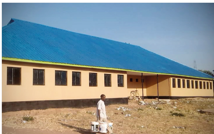
Een nieuw dak en laagje verf voor de slaapzalen van de jongensschool.

Ook op onze secundaire jongensschool in Singida werd er hard gewerkt door onze bouwploeg. In tegenstelling tot onze lagere en secundaire school in Igunga werd deze school niet door pater Bolle zelf uit de grond gestampt. Maar hij heeft wel een groot deel van zijn leven in het bisdom van Singida gewerkt en maakte ook daar een onvergetelijke indruk. Geïnspireerd door Bolle's voorbeeld startte het bisdom van Singida enkele jaren geleden een secundair jongensinternaat om kwalitatief Engelstalig onderwijs te kunnen aanbieden aan de kansarmen uit de regio. In 2020 riep de bisschop de hulp in van Bollé Bollé om de school verder uit te breiden. Via een overeenkomst met het bisdom werd overeengekomen dat Bollé Bollé een aantal grote infrastructuurwerken zou uitvoeren. In ruil daarvoor kregen we de garantie dat de weesjongens uit pater Bolle's weeshuis in Bukoba er steeds gratis naar school zullen kunnen gaan.