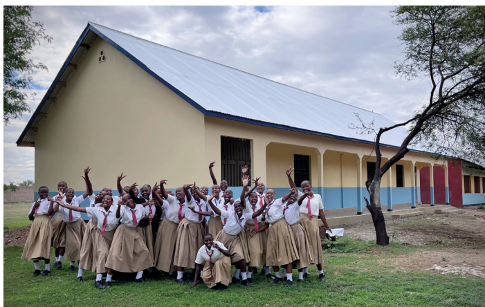
Enthousiaste leerlingen voor de nieuwe computerklas op de meisjesschool.

Daarnaast blijven we met Bollé Bollé investeren in beter onderwijs. Toen we op onze secundaire meisjesschool in 2011 als allereerste school in de provincie Tabora een computerklas in gebruik namen, was dat naar Tanzaniaanse normen best vooruitstrevend. Maar zoals gezegd zet Tanzania jaar na jaar enorme stappen voorwaarts en tegenwoordig worden zelfs een aantal van de nationale examens in het 4de middelbaar alleen nog afgenomen via internet. Na 12 jaar waren dus niet alleen onze computers maar ook onze computerklas zelf aan een stevige upgrade toe. In 2023 bouwden we daarom op ons secundair meisjesinternaat een gloednieuwe computerklas. Het nieuwe lokaal is met een lengte van 20 meter en plaats voor ruim 50 computers meer dan dubbel zo groot als de oude klas. Geen droom maar alweer een grote stap voorwaarts om de jeugd klaar te stomen voor de toekomst.