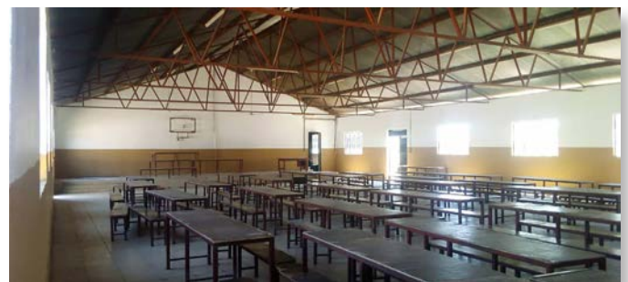
Ook de binnemuren werden voorzien van een nieuwe pleisterlaag en verf.

Op dezelfde school werd de voorbije maand eveneens gestart met de bouw van twee nieuwe kleuterklassen, een leraarskamer en berging. Bedoeling is dat de kleuters begin volgend jaar kunnen verhuizen naar de nieuwe klassen. Aansluitend op de nieuwe klassen krijgen ze een eigen stukje speelplaats. De bestaande kleuterklassen zullen nadien omgebouwd worden tot schoolbibliotheek.