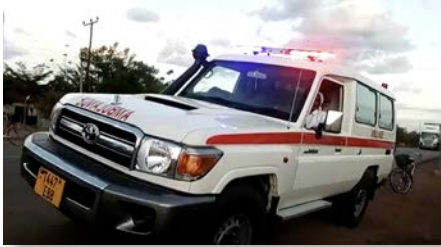
Onderweg naar Igunga.