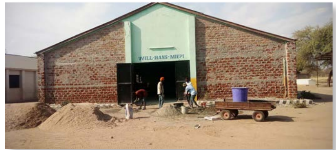
Renovatiewerken aan de buitengevels van de graduation hall.

Ook op onze lagere school in Igunga werd er hard gewerkt. Elf jaar nadat de eerste leerlingen daar aan onze Engelstalige basisschool afstudeerden in een gloednieuwe 'graduation hall', was het tijd voor wat renovatiewerken. Alle muren werden zowel binnen als buiten voorzien van een nieuwe pleisterlaag en nadien een nieuw lekje verf. Het gebouw wordt immers intensief gebruikt, niet alleen als graduation hall of eetzaal voor de 600 leerlingen van de school, maar ook als multifunctionele hal voor debatten, voorstellingen, vergaderingen, ja zelfs voor de verkiezingen van het land. In augustus van dit jaar vond er nog een nationale volksraadpleging plaats. Zo verzamelden 120 willekeurig gekozen burgers uit het district Igunga drie weken lang in onze graduation hall om er samen na te denken en te discussiëren over de belangrijke toekomstthema's van het land (onderwijs, gezondheidszorg, milieu & klimaat, werk, sociale zekerheid, energie, enzovoort).