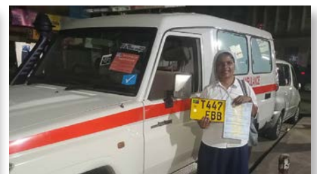
Ophalen van de ambulance in Dar es Salaam.