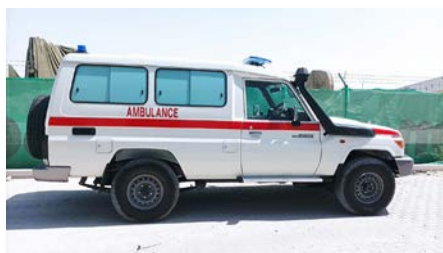
Onze gloednieuwe ziekenwagen.