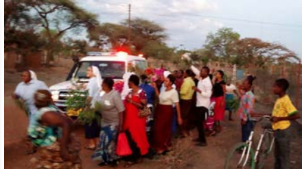
Ontvangstcomité bij aankomst in Mwanuzigi.