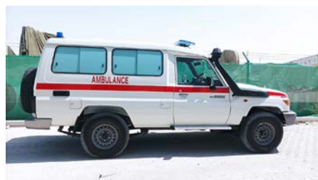
Notre ambulance toute neuve.