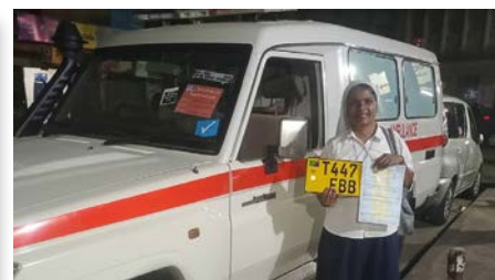
Réception de l’ambulance à Dar es Salaam.