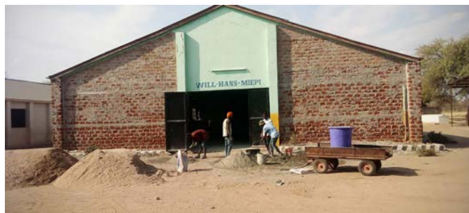
Travaux de rénovation à la façade extérieure du graduation hall.

Egalement à notre école primaire à Igunga on a travaillé d’arrache-pied. Onze ans après que les premières élèves y aient obtenu leur diplôme à notre école anglophone dans un “graduation hall” tout neuf, quelques travaux de restauration s’imposaient. Tous les murs intérieurs comme extérieurs ont été replâtrés et ont reçu un nouveau coup de peinture. Le bâtiment est en effet utilisé de façon intensive, non seulement comme graduation hall ou réfectoire pour les 600 élèves de l’école, mais aussi comme halle multifonctionnel pour débats, représentations, réunions, oui même pour les élections nationales. Au mois d’août de cette année un référendum y a encore eu lieu. Ainsi 120 citoyens choisis au hasard en provenance du district d’Igunga se sont réunis pendant trois semaines dans notre graduation hall pour se concerter et pour discuter sur les thèmes importants au niveau de l’avenir du pays (enseignements, soins de santé, milieu & climat, travail, sécurité sociale, énergie, et cetera).