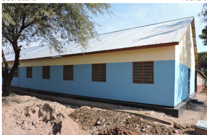
Le dernier dortoir à notre école secondaire pour filles.