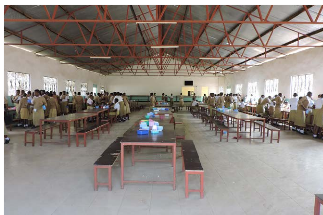
Les étudiants font la queue pour manger aux nouvelles tables et bancs dans le réfectoire.