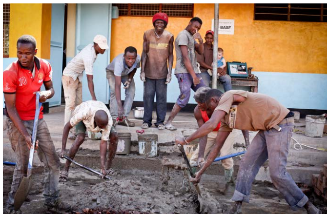
De bouwploeg maakt beton klaar voor de vloer van het labo.