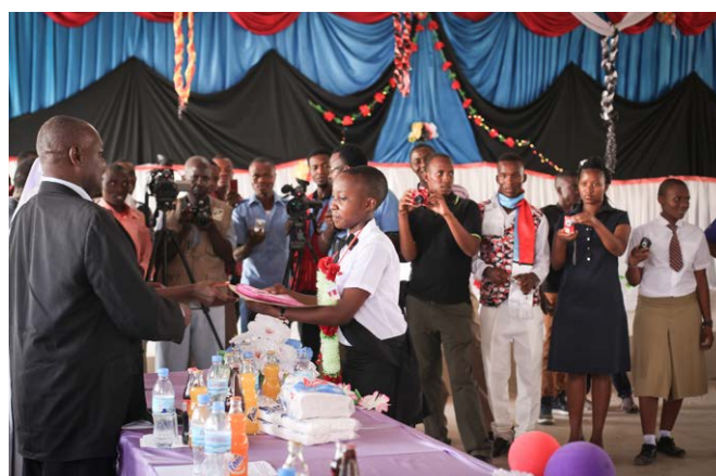
Diploma-uitreiking op het afstudeerfeest van onze secundaire school: een onvergetelijke dag voor alle aanwezigen.