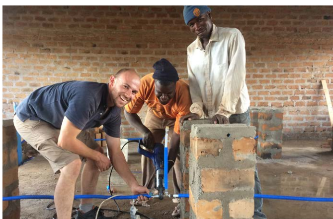
Water- en gasleidingen persen: nog nooit gezien in Tanzania.