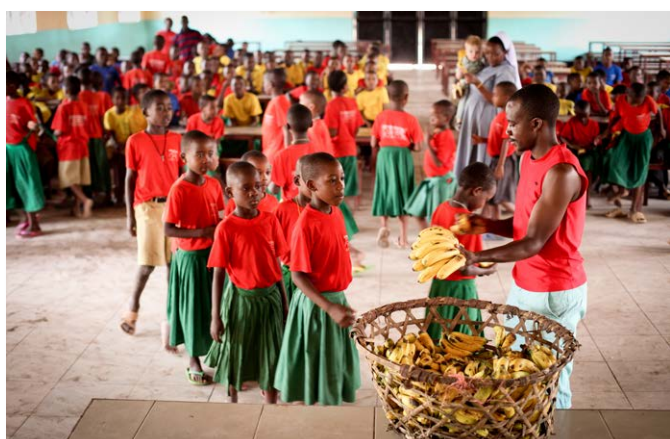
Dankzij Bollé Bollé krijgen de leerlingen van onze lagere school twee keer per week extra fruit.