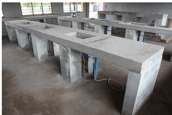
Het eindresultaat na drie weken hard werken.