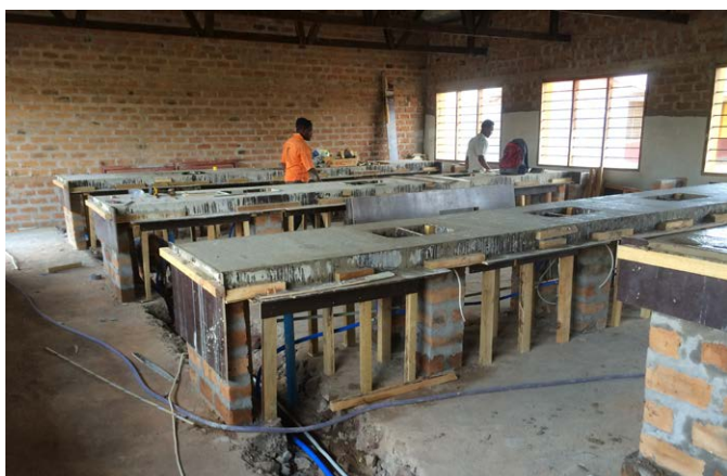
Ter plaatse gestorte betonnen werkbladen.