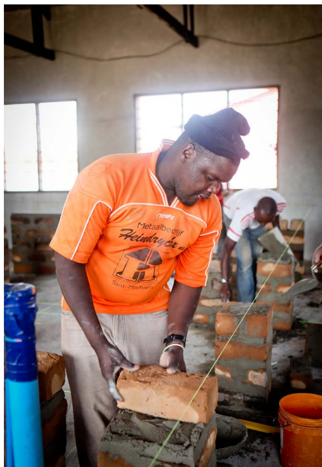
Metselen met de lokale bakstenen: niet gemakkelijk!